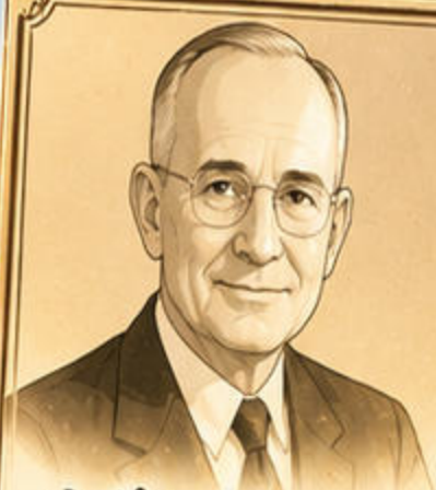
ナポレオン・ヒル